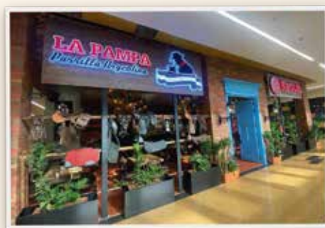
ENVIGADO - C.C. CITYPLAZA