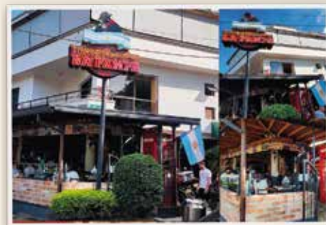
TER PARQUE DE LAURELES